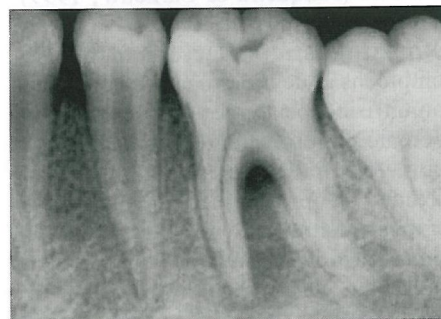
Figura 2 - Exame radiográfico inicial

O teste de vitalidade pulpar com gás refrigerante foi negativo, concluindo-se o diagnóstico clínico provável de abscesso periapical evoluído (Estrela et al 4 1999). Tratando-se, portanto, de uma lesão endodôntica, a terapia instituída foi abertura coronária, sanificação e modelagem dos canais radiculares, seguida de duas trocas de medicação intracanal com hidróxido de cálcio, escolhido por sua comprovada efetividade antimicrobiana e reparadora (Estrela & Holland 5 2004). A obturação do canal radicular foi realizada após 60 dias (figura 3).