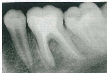
Figura 3 - Exame radiográfico final após 60 dias.

O teste de vitalidade pulpar com gás refrigerante foi negativo, concluindo-se o diagnóstico clínico provável de abscesso periapical evoluído (Estrela et al 4 1999). Tratando-se, portanto, de uma lesão endodôntica, a terapia instituída foi abertura coronária, sanificação e modelagem dos canais radiculares, seguida de duas trocas de medicação intracanal com hidróxido de cálcio, escolhido por sua comprovada efetividade antimicrobiana e reparadora (Estrela & Holland 5 2004). A obturação do canal radicular foi realizada após 60 dias (figura 3).