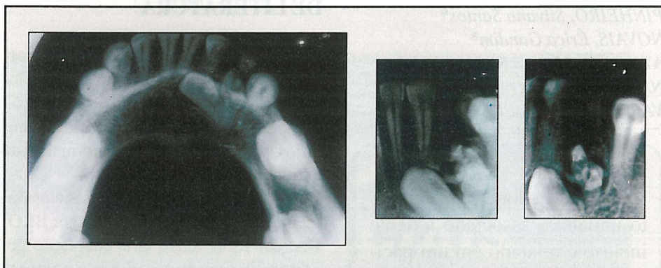
FIGURA 1 - Radiografias oclusal e periapicais em incidências orto e distorradial com imagens da massa irregular de material calcificado e presença de canino incluído

Nas radiografias panorâmica, telerradiografia de perfil, oclusal e periapical, foi detectado entre as raízes dos dentes incisivo lateral inferior e elemento decíduo, uma massa irregular de material calcificado circundada por um halo radiotransparente fino, com periferia regular, assemelhando-se, estruturalmente, a dentes. As radiografias ainda revelavam a presença do canino inferior esquerdo, totalmente incluso (Figuras 1 e 2).