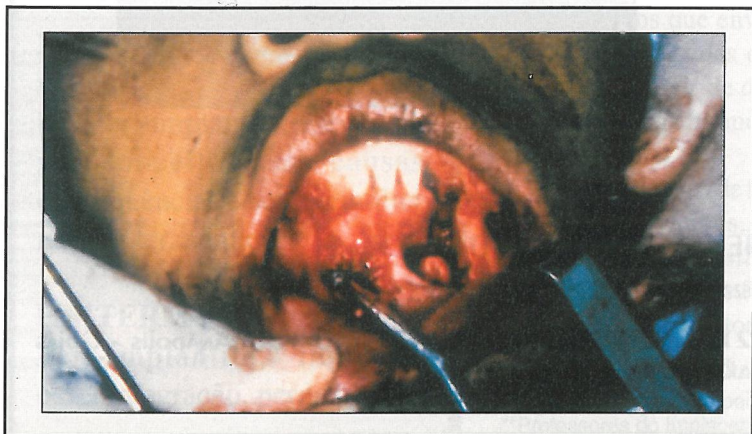
FIGURA 3 - Aspecto cirúrgico da ressecção óssea