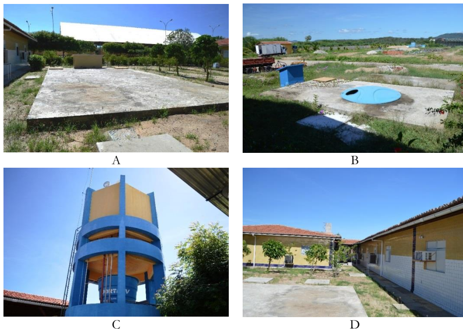
Figura 4. Vista dos reservatórios de água de chuva no campus de Currais Novos (A – reservatório; B – reservatório; C – reservatório elevado; D – detalhe das calhas de captação).