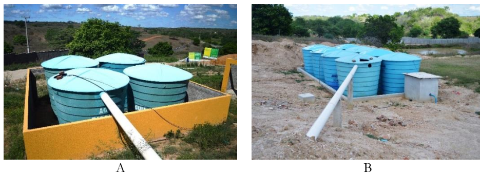
Figura 3. Vista dos reservatórios de água de chuva no campus de São Paulo do Potengi (A – captação do prédio principal; B – captação do ginásio de esportes).

área de captação vem sendo ampliada, sendo atualmente o campus que apresenta a maior área com o sistema de calhas implantado para a captação das águas de chuva com aproximadamente 3500 m 2 .