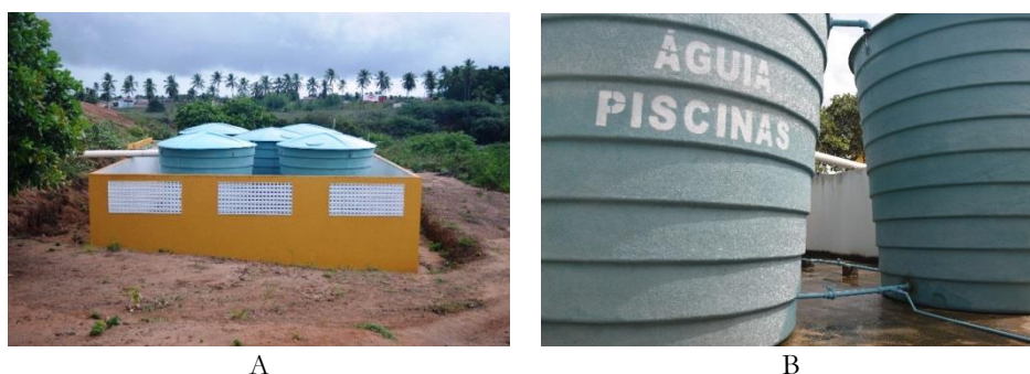
Figura 2. Vista dos reservatórios de água de chuva no campus de Ceará-Mirim (A – vista geral; B – detalhe do extravasor e vasos comunicantes).