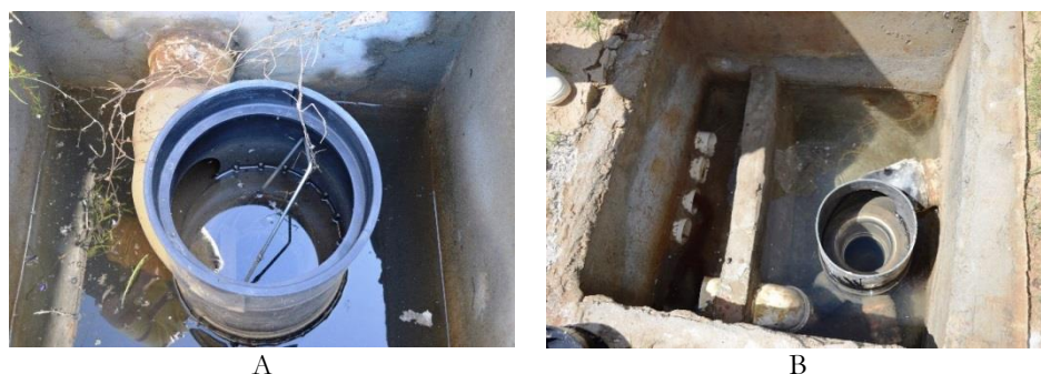
Figura 5. Vista dos filtros instalados a montante dos reservatórios no campus de Currais Novos.

específicas para a desinfecção de água para consumo humano. Durante as inspeções dos sistemas nas visitas in loco foi observado que os dispositivos de proteção sanitária a montante dos reservatórios já estavam há muito tempo sem manutenção, contendo muita vegetação e areia dentro das caixas de passagem e, em alguns dos filtros as telas não haviam sido instaladas (Figura 5).