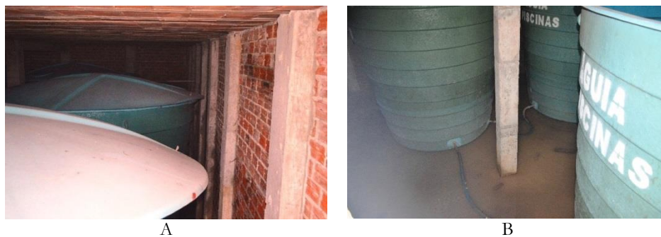
Figura 1. Vista dos reservatórios de água de chuva no campus de Canguaretama (A – prédio principal; B – prédio anexo).

Figura 2 mostra a boa infraestrutura reservada ao sistema de armazenamento de água de chuva, inclusive com extravasor e vasos comunicantes.