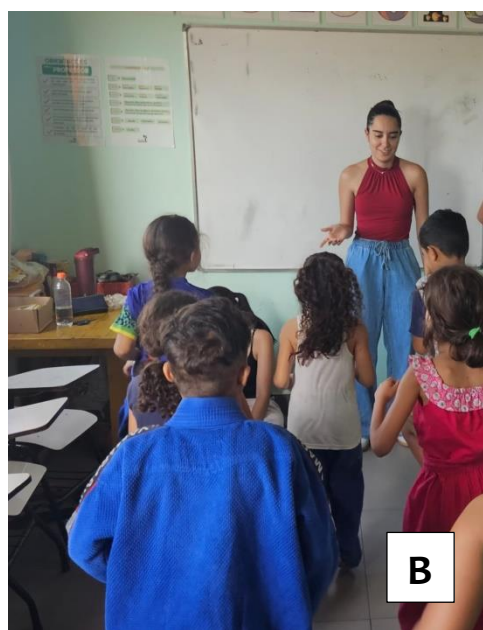
Figura 3A - Atividade “verdade ou mito” e exercícios corporais realizados em sala, nessa atividade os autores faziam perguntas sobre atividades do dia a dia e as crianças respondiam se eram saudáveis ou não, as crianças que respondiam errado tinham que fazer dez polichinelos, assim conciliando o conhecimento e práticas saudáveis de exercícios físico. Figura 3B - Momento de encerramento da atividade e orientação para as crianças sobre hábitos saudáveis e acerca da importância de manter o hábito da atividade física.

A recepção das crianças foi positiva em todos os momentos, com elevada participação e interesse nas atividades propostas. Entretanto, um dos desafios encontrados foi a adaptação da linguagem para diferentes faixas etárias, exigindo ajustes constantes na forma de comunicação. Para superar essa dificuldade, a equipe utilizou exemplos do cotidiano, linguagem acessível e estratégias lúdicas, o que favoreceu a compreensão dos conteúdos.