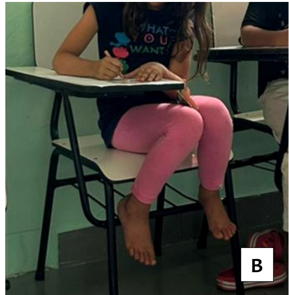
Figura 1A – Brincadeira de batata quente, assim que a bola parava em uma das crianças a mesma deveria se apresentar com nome, idade e responder, quais seus sonhos, medos e qual profissão desejava exercer no futuro. Essa dinâmica foi realizada com o intuito de conhecer melhor as crianças e criar um vínculo de confiança entre elas e os autores. Figura 1B – As crianças desenhando imagens de objetos que eram importantes para elas, para posteriormente serem usadas para fazer a dinâmica “Quem sou eu”.

No segundo dia, as atividades foram direcionadas a crianças de 5 a 7 anos, sendo estruturadas em momentos sequenciais. Inicialmente, realizou-se a acolhida, promovendo um ambiente de confiança e interação. Em seguida, foi aplicada a dinâmica do semáforo, utilizando as cores verde, amarelo e vermelho para representar ações como movimentar-se, atenção e parar, respectivamente (Figura 2A). Posteriormente, foi realizada uma explicação sobre o corpo humano, enfatizando a importância do respeito e do autocuidado.