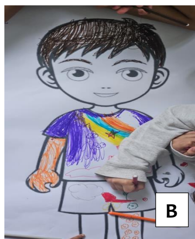
Figura 2A - Aplicação da dinâmica do semáforo com as crianças, com o intuito de orientar sobre áreas que não devem ser tocadas por outras pessoas, áreas que as crianças devem ter atenção quando tocadas e regiões que podem ser tocadas. Figura 2B - Atividade de pintura em grupo com participação das crianças a fim de promover um momento de descontração e interação das crianças.

No terceiro dia, a intervenção foi realizada com crianças de 7 a 9 anos, com foco no tema “movimento e saúde”. A proposta teve como objetivo incentivar hábitos saudáveis por meio de atividades simples, adaptadas ao ambiente da sala de aula. Para isso, foram utilizados materiais de fácil acesso, como papéis com as palavras “verdade” e “mito”, além de marcações no chão para organização da dinâmica. Na nossa percepção, a utilização de recursos simples e interativos contribuiu para tornar o conteúdo mais próximo da realidade das crianças, favorecendo maior participação e interesse durante a atividade.