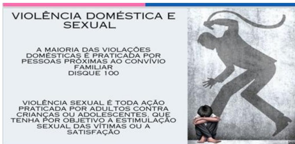
Figura 4 - Slide informando os conceitos de violência doméstica e sexual, além do número emergencial.

opções de contracepção são fornecidas pelas instituições governamentais de saúde. Por último, foi falado também sobre as formas de violência, principalmente doméstica e sexual (figura 4) conscientizando sobre as maneiras como podem ocorrer e informando sobre as possibilidades de contato e busca de ajuda nesses casos.