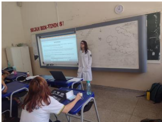
Figura 2 - Discente do curso de medicina em roda de conversa sobre os temas ministrados.

com perguntas direcionadas a respeito dos assuntos, acompanhadas da parte expositiva, em que os acadêmicos em um primeiro momento apresentaram o tema (figura 2) e deixavam a turma discutir e expor as próprias opiniões, e depois era complementado e explicado cada tópico de forma técnica, elucidando a respeito de informações, conhecimentos ou direitos desconhecidos pelos menores.