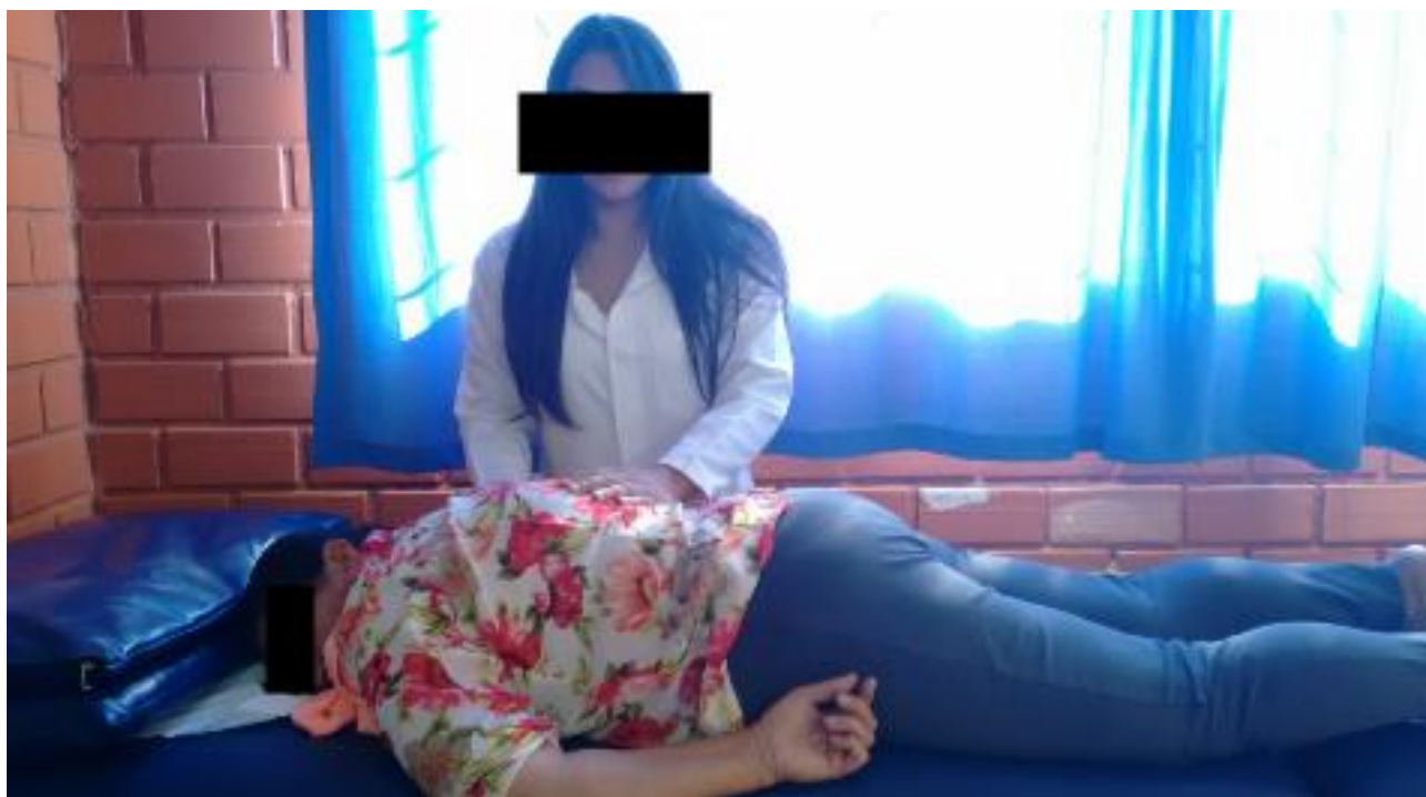
Figura 3 - Paciente posicionada pela acadêmica de fisioterapia para verificar a veracidade e condições de posicionamento. Verifica-se o braço em rotação interna apoiado junto ao corpo.