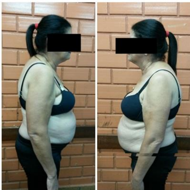
Figura 2 - Paciente em avaliação fisioterapêutica: observa-se em vista lateral direita e esquerda a cabeça protusa, hipercifose torácica, hiperlordose lombar e pelve em retroversão.