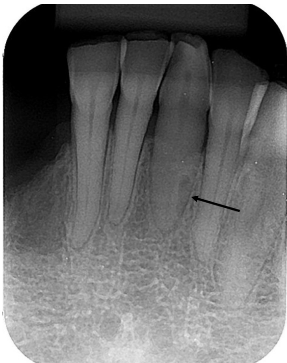
Figura 1 – Radiografia periapical onde se observa imagem radiolúcida no terço apical da raiz do dente 31, apresentando como hipótese de diagnóstico reabsorção radicular externa.

Uma paciente do gênero feminino, 72 anos de idade, gênero feminino, foi examinada na Clínica Odontológica de Ensino da UniEVANGÉLICA com a seguinte queixa principal: "Quero trocar minha prótese". Durante o exame clínico não foram constatadas alterações sistêmicas contributórias para o caso em questão. Após este exame foram realizadas radiografias periapicais dos dentes remanescentes para a avaliação pré-protética.